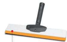
GLÄTTER MIT STEIFER KLINGE 3 Grössen : 250, 350 und 500 mm