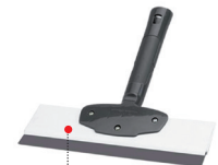
GLÄTTER MIT BIEGSAMER KLINGE 3 Grössen : 250, 350 und 500 mm