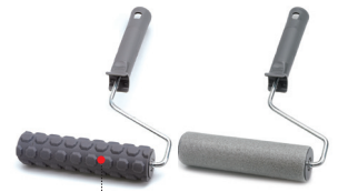
RELIEF ROLLER ODER GLÄTTER ROLLER