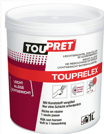
POT : 1 L