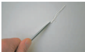
SUPPORT BRUT TENDRE

■ Rayer le support à l'aide d'un tournevis. Si l'outil pénètre facilement, le support est considéré comme tendre.