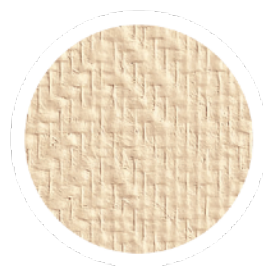
Toile de verre