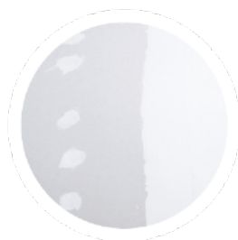
Plaque de plâtre